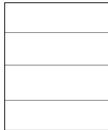
feuille à préparer